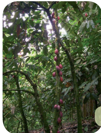
Cacaoyer « Nacional », Equateur.

Les cacaoyères et les caféières agroforestières constituent une forme traditionnelle de production, dont le fonctionnement s'apparente à celui d'une forêt. Par rapport aux systèmes en culture pure, elles produisent moins de cacao ou de café, mais elles sont plus durables et plus respectueuses de l'environnement car leur conduite exige généralement moins de pesticides et d'engrais chimiques. Les agriculteurs en tirent d'autres productions qu'ils consomment ou commercialisent (fruits divers,