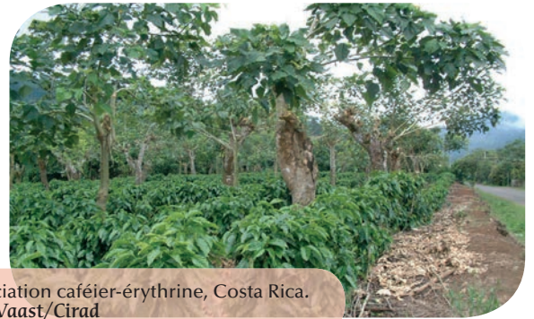
Association caféier-érythrine, Costa Rica.

Comprendre et accompagner le développement de ces systèmes implique d'analyser les savoirs locaux, les stratégies et les pratiques des différents acteurs impliqués dans les filières du cacao et du café. La recherche s'intéresse aussi aux processus d'innovation, à l'évolution des filières et à l'impact paysager de l'agroforesterie.